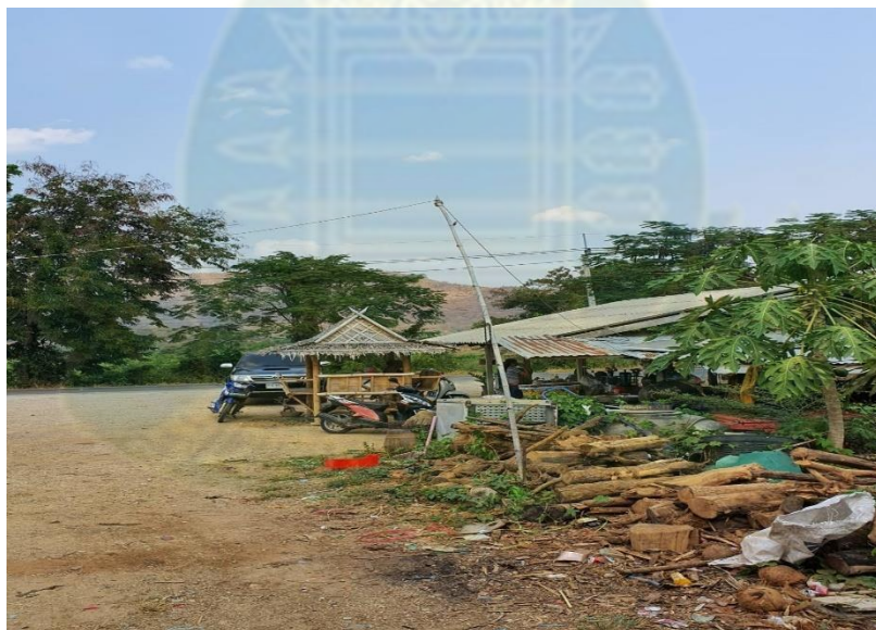
ภาพที่ 11 บ้านในหมู่บ้านวังวน ซึ่งไม่ได้รับอนุญาตให้ใช้ไฟฟ้า