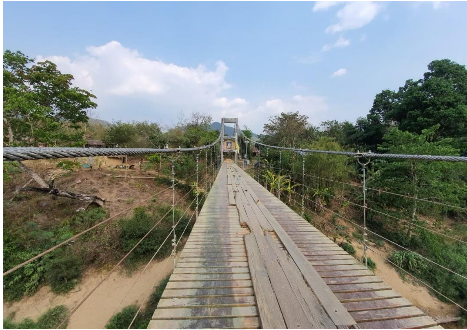
ภาพที่ 6 ทางเข้าหมู่บ้านบางกลอย (ทำได้โดยการข้ามสะพานเท่านั้น)