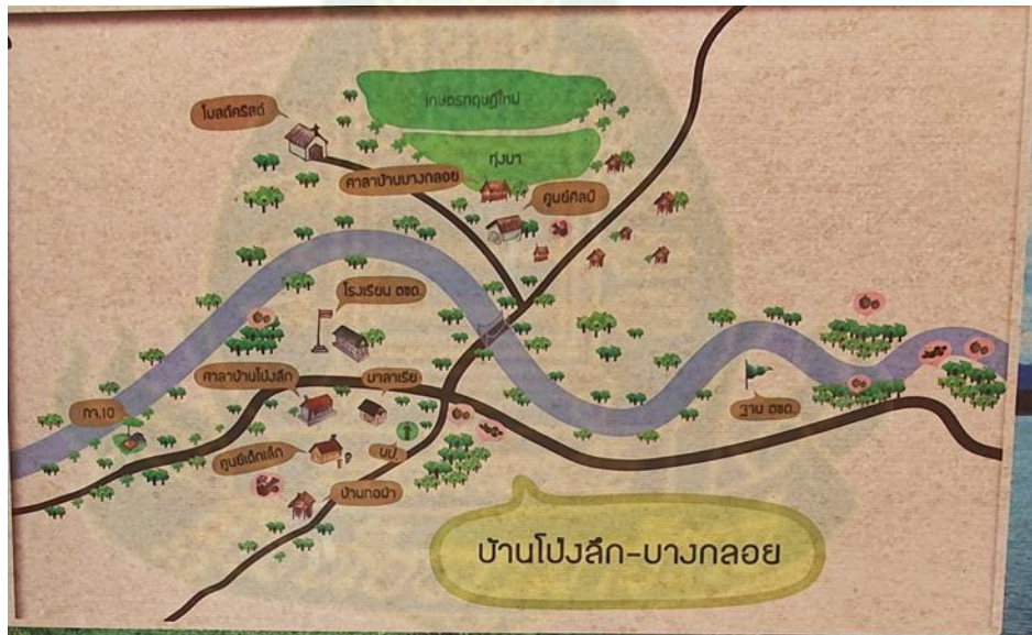
ภาพที่ 7 แผนที่หมู่บ้าน โป่งลึก-บางกลอย (บางกลอยล่าง)