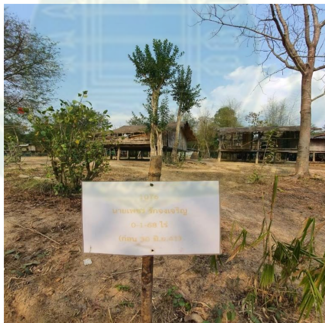
ภาพที่ 8 ป้ายแสดงการจัดสรรที่ดินโดยเจ้าหน้าที่ให้แก่ นายเพชร รักรังเจริญ จำนวน 0.168 ไร่

คนกะเหรี่ยงหรือเหตุผลอื่นๆ ในการเข้ามาควบคุม จัดการ และปกครอง โดยการ “จัดสรรพื้นที่” ให้คนกะเหรี่ยงสามารถอยู่อาศัยได้เฉพาะพื้นที่ซึ่งรัฐจัดสรรเอาไว้เท่านั้น การที่เจ้าหน้าที่รัฐบังคับอพยพชาวกะเหรี่ยงอพยพจากพื้นที่บ้านของตนเอง และถูกบีบบังคับให้มาอยู่ในพื้นที่ใหม่ที่รัฐจัดสรรให้ จึงเป็นเสมือน “การล้อมกรอบ” ใน 2 ความหมายคือ หมายถึง “การล้อมรั้ว” ให้กับอุทยานแห่งชาติแก่งกระจาน เพื่อไม่ให้ทรัพยากรธรรมชาติ “ถูกทำลาย” จากกลุ่มคนกลุ่มชาติพันธุ์กะเหรี่ยง โดยเชื่อว่าจะทำให้พื้นที่ไม่ถูก “รุกราน” และทำให้ยังคงอุดมสมบูรณ์อยู่ได้ และในความหมายที่สองคือ “การล้อมกรง” ชาวกะเหรี่ยงให้อยู่ในพื้นที่ซึ่งรัฐจัดสรรให้เท่านั้น ไม่ว่าพื้นที่ดังกล่าวจะเป็นอย่างไร มีพื้นที่จำกัดอย่างไรและมีความแห้งแล้งอย่างไรก็ตาม ชาวกะเหรี่ยงจำเป็นต้องอยู่ในพื้นที่ดังกล่าว ในแง่นี้ชาวบ้านบางกลอยล่างจึงไม่ต่างอะไรกับการอยู่ภายใต้ “วงล้อมปิด” (enclave) ที่สร้างโดยรัฐ ซึ่งพยายามควบคุมและจำกัดการเคลื่อนที่ไปมา ให้ชาวกะเหรี่ยง “อยู่กับพื้นที่เดิม” (sedentary) เท่านั้น ซึ่งการต้องอยู่บนพื้นที่เดิมและการไม่เคลื่อนย้ายไม่สอดคล้องตามวิถีการดำรงชีวิตของพวกเขา ด้วยเหตุนี้ แม้ภายหลังการบังคับอพยพย้ายถิ่นชาวกะเหรี่ยงจำนวนมากก็ยังนิยามว่าใจแผ่นดิน หรือบางกลอยบนนั้นคือ “บ้าน” ของพวกเขา และยังคงความคลางแคลงและกังวลใจในการเรียกพื้นที่ใหม่ที่ “บ้าน” ดังที่มีการหวนรำลึกถึงสภาพความน่าอยู่ ความงดงามของธรรมชาติ และความเขียวจีและสัตว์ป่านานาชนิด ตลอดจน การที่คนจำนวนหนึ่งยังคงความต้องการกลับขึ้นไปยังใจแผ่นดิน หรือบางกลอยบนอยู่ (นิรันดร์ พงษ์เทพ, สัมภาษณ์, 22 สิงหาคม 2564)