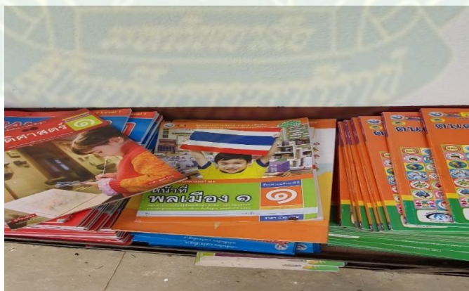
ภาพที่ 10 หนังสือหน้าที่พลเมือง 1 (ภาพเด็กเลื้อยเหลืองซุงชชาติ) ที่ชั้นหนังสือหน้าห้องเรียนในโรงเรียน

แต่จากกิจกรรมข้อสอบดังกล่าวดูเหมือนจะเป็นเรื่องผิวเผิน และเป็นการถามง่ายๆ “เหมาะสมกับความเป็นเด็ก” แต่ทว่าในอีกแง่มุมมองหนึ่งเป็นเสมือนการอบรมสั่งสอน และดูราวกับว่าต้องการให้เด็กนักเรียนท่องจำให้ได้ว่า คนที่อยู่ในประเทศไทยต้องมี “ความเป็นไทย” และต้องใช้ภาษาไทย แต่ในอีกแง่มุมมองหนึ่งแล้ว สิ่งที่ไม่ถูกกล่าวถึงอย่างตรงไปตรงมา แต่ทว่าซ่อนนัยเอาไว้คือ ภาษา อัตลักษณ์ และความเป็นคนกลุ่มชาติพันธุ์กะเหรี่ยง ไม่ใช่สิ่งประจำชาติและไม่มีมีความสำคัญแต่อย่างใด ในแง่นี้ การที่รัฐไทยพยายามกลืนกลายทั้งผู้ใหญ่และเด็กชาวกะเหรี่ยงเข้าสู่วัฒนธรรมและอัตลักษณ์แบบไทยนั้น เป็นเพียงการทำให้เขากลายเป็นสิ่งที่ธงชัย วินิจจะกุล (2560: 51) เรียกว่า “คนอื่นในสังคมไทย” เท่านั้น กล่าวคือเป็นการกลืนกลายที่สร้างความแปลกแยกแตกต่างให้กับคนกลุ่มชาติพันธุ์เหล่านี้ในฐานะคนที่ต่ำต้อยกว่าคนไทย